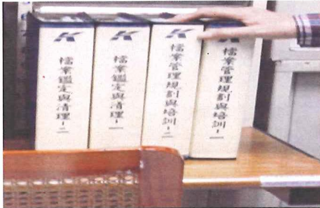
捷運局檔案鑑定資料