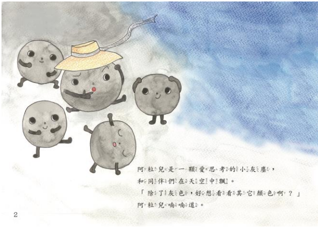
樣書範例(A4 彩印加文字頁碼)