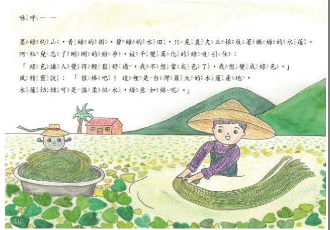
樣書範例(A4 彩印加文字頁碼)